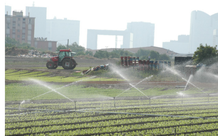
La Plaine de Montesson (78)

Des conférences-débats consacrés au thème «Territoire durable, territoire de liens» dans un premier cycle qui explore l'émergence de rapprochements nouveaux entre la Ville et l'Agriculture : L'agriculture au cœur des enjeux de l'aménagement urbain et territorial Nouveaux usages du sol le 11 mars 2008 Nouvelles pratiques, nouveaux métiers le 15 avril 2008 Visites de terrain en mai 2008 (à préciser)