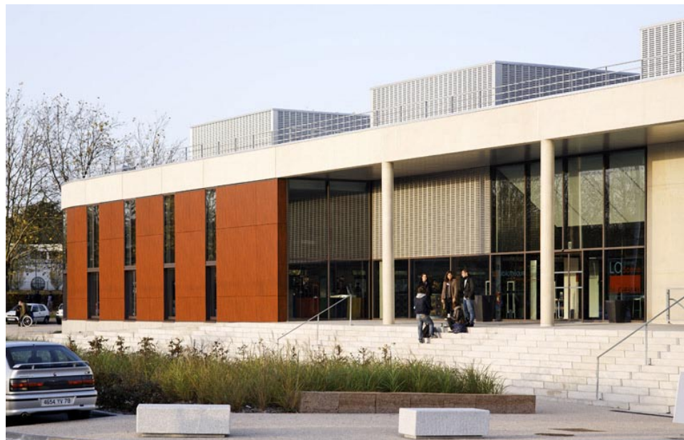
Badia-Berger, architectes

Les ERP doivent, pour les parties recevant ou ouvertes au public, permettre aux personnes handicapées d'accéder, de circuler, recevoir les informations diffusées et accéder aux services ou activités proposés avec la plus grande autonomie possible. Dans sa conception et jusqu'au bout de la réalisation, tout ERP neuf doit répondre aux exigences qui permettent de le rendre véritablement accessible sans oublier les handicaps ou situation handicapante que peut connaître tout un chacun. L'obligation d'accessibilité porte sur les parties extérieures et intérieures des établissements depuis l'emprise publique jusqu'au bâtiment et elle vise les places de stationnement automobile affectées aux personnes à mobilité réduite, les cheminements extérieurs et intérieurs, les ascenseurs, les accès, les locaux avec leurs équipements.