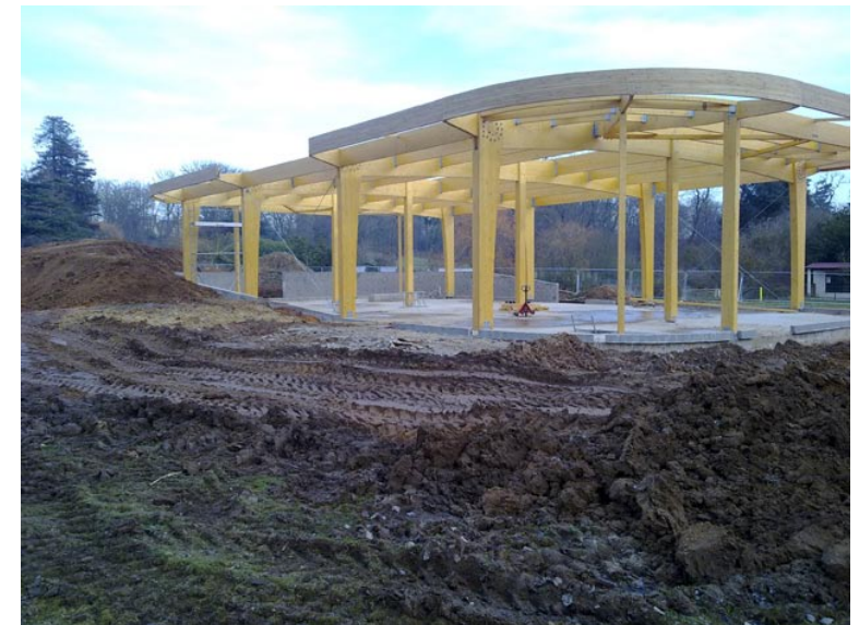
Arche des petites bêtes - Thoiry (78)