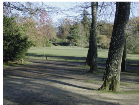
Prairie avant travaux - Thoiry (78)