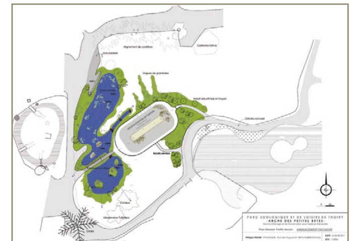
Plan masse + profil terrain - aménagement paysager © Philippe Peiger, paysagiste concepteur