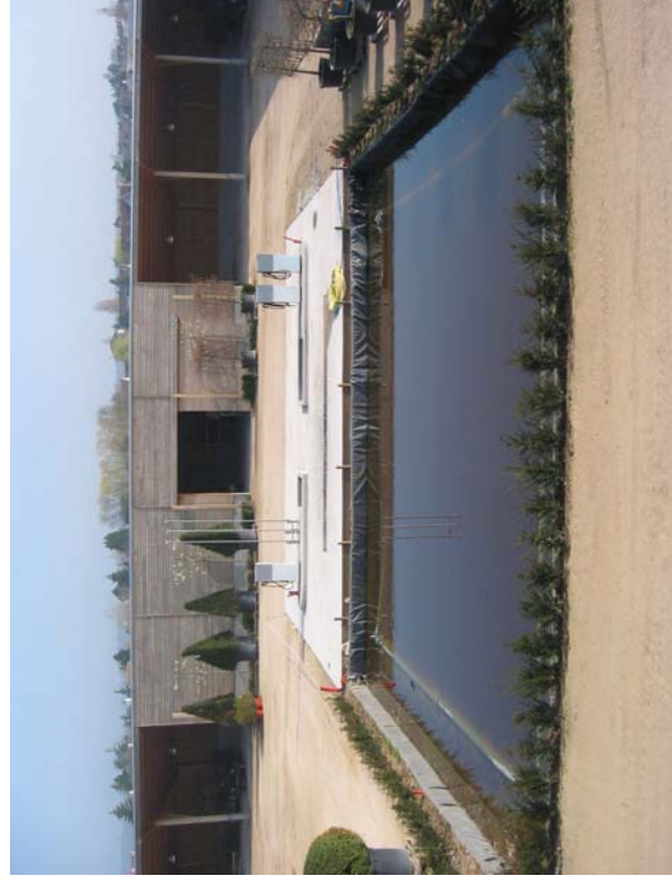
Art Topia, Saint-Nom-la-Breèche (78)

Une entreprise de compagnons jardiniers sur la Plaine de Versailles